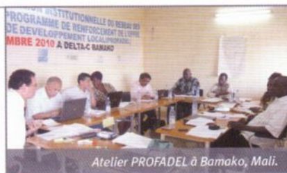
Atelier PROFADEL à Bamako, Mali.