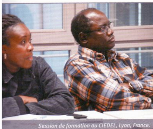
Session de formation au CIEDEL, Lyon, France.

• La VAE (Validation des Acquis de l'Expérience) est un dispositif qui permet de faire reconnaître l'expérience (professionnelle ou non) d'une personne afin d'obtenir la totalité ou une partie du titre.