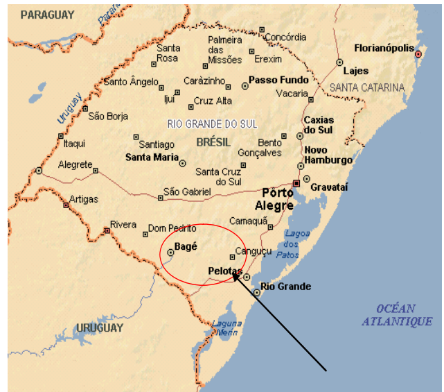
Região da Campanha

O apoio à reforma agrária, desafio partilhado por todos os seus atores, está na sua transformação em um real processo social, econômico e territorial de consolidação de uma agricultura familiar. Quais ensinamentos retirar destes quinze anos de experiência numa área de reforma agrária em crescimento constante e que hoje está no centro de todas as atenções por parte do governo federal? Para Agrônomos e Veterinários Sem Fronteiras, a análise das condições e os limites do êxito da reforma agrária desenvolvida na região de Bagé, necessita de uma reflexão sobre nossas modalidades de intervenção em matéria de acompanhamento dos pequenos agricultores, de construção e viabilização das cadeias produtivas e em termos de colaboração com um movimento social muito poderoso.