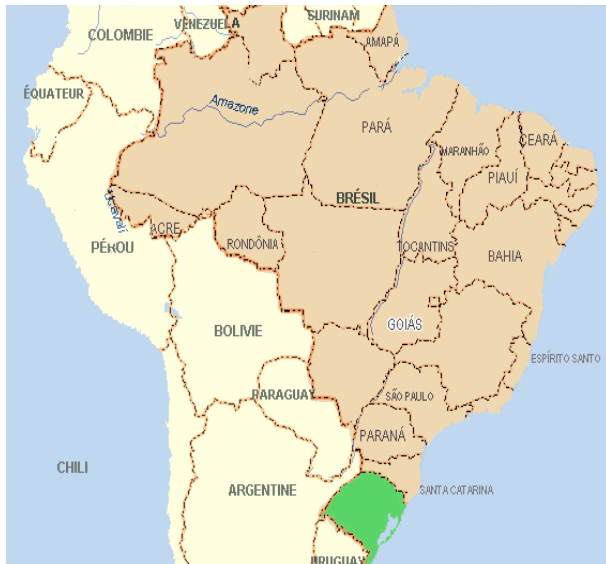
Estado do Rio Grande do Sul

Agrícola), fez contato com o MST em 1986, para definir conjuntamente um programa de apoio à viabilização das áreas de reforma agrária na região da Campanha, ao sul do Estado do Rio Grande do Sul.